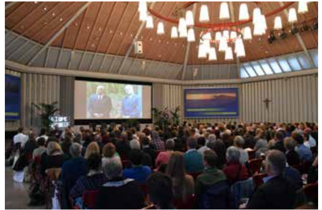
Udsnit af de 300 deltagere