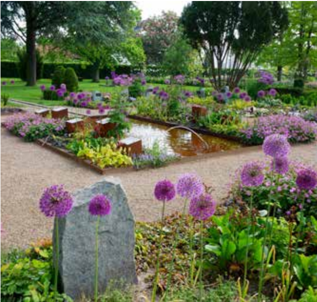
Kildespringshaven maj. Der er allerede solgt en del gravsteder i denne afdeling.