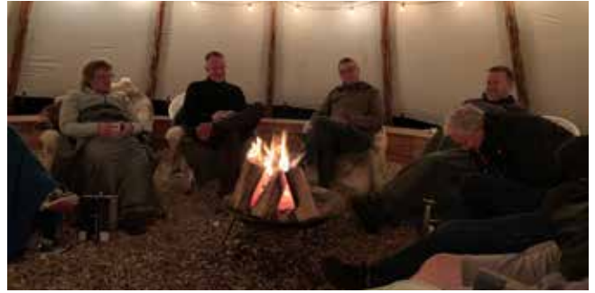
Et af de forhold, der har været med til at styrke netværket er, at der i forbindelse med de årlige møder også sættes tid af til hygge og socialt samvær under mere private forhold.

Op til 2007 havde FAKK arrangeret forskellige AMU-kurser målrettet gravere og kirkegårdsledere, men de kunne ikke fortsætte det arbejde. Det nye netværk valgte derfor at tage teten.