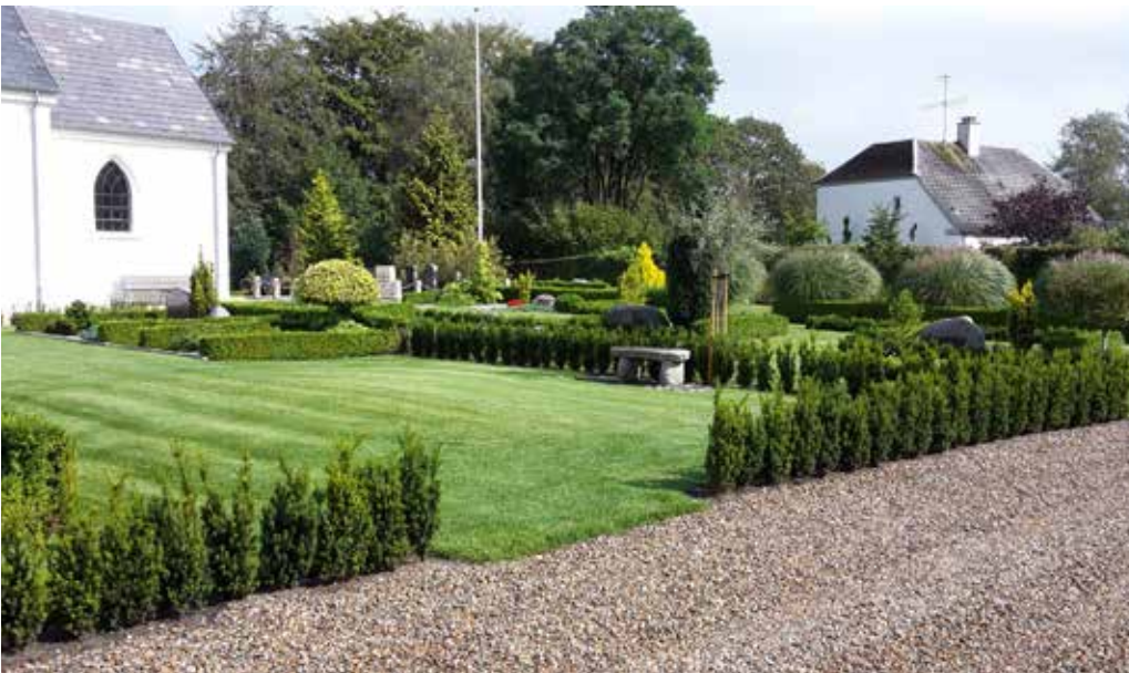
De nye græsarealer er anlagt i sammenhæng – og så plæneklipperen kan komme til.

— Området holdes åbent for erhvervelse af nye gravsteder nu. Efterhånden som der indenfor det blå-stiplede område bliver etableret gravsteder, der skal afløse de nuværende parkgravsteder, lukkes der for ibrugtagning af nye gravsteder.