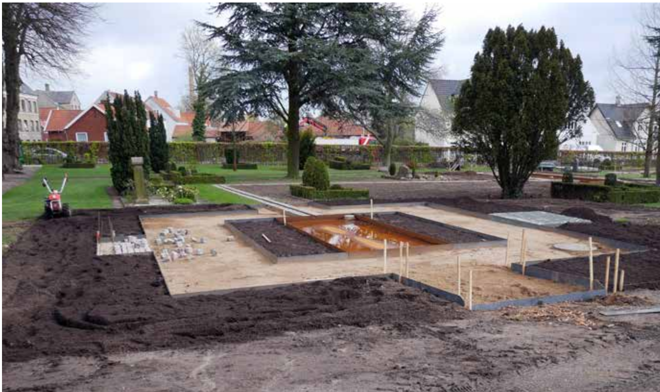
Der er ved at være klar til at plante i Kildespringshaven.

vinkler for dermed at give en reference til den militære historie.