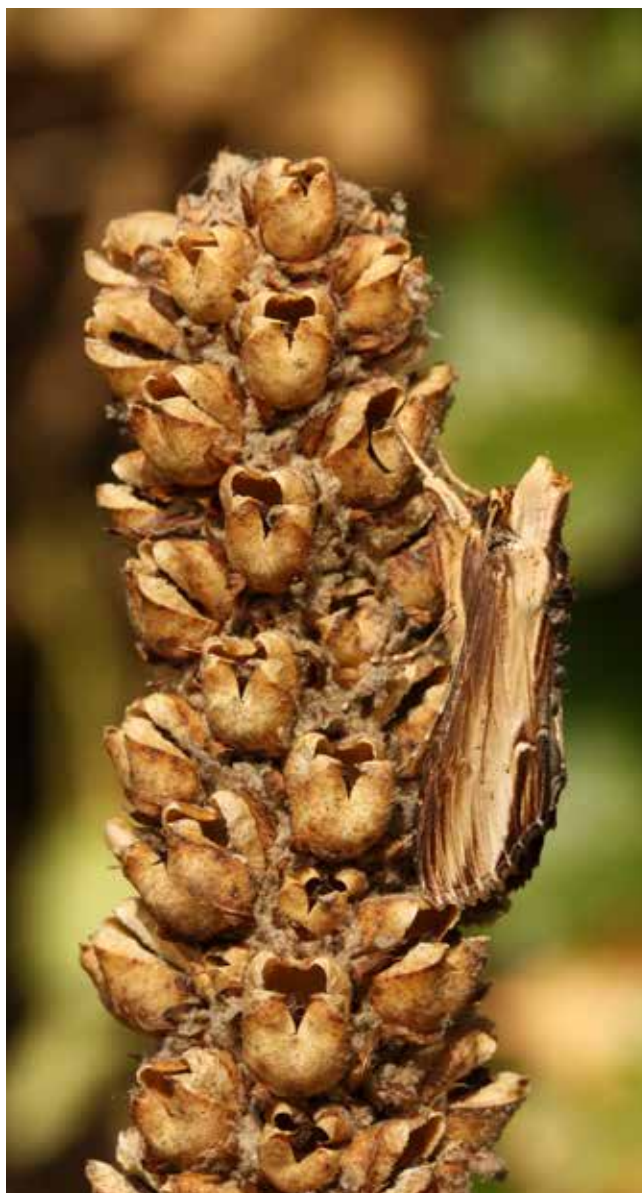
Filtbladet Kongelys-Hætteugle som larve (Ikke før dokumenteret i Ribe) og voksen. Den voksne Filtbladet Kongelys-Hætteugle er fotografert af Erik Steen Larsen.