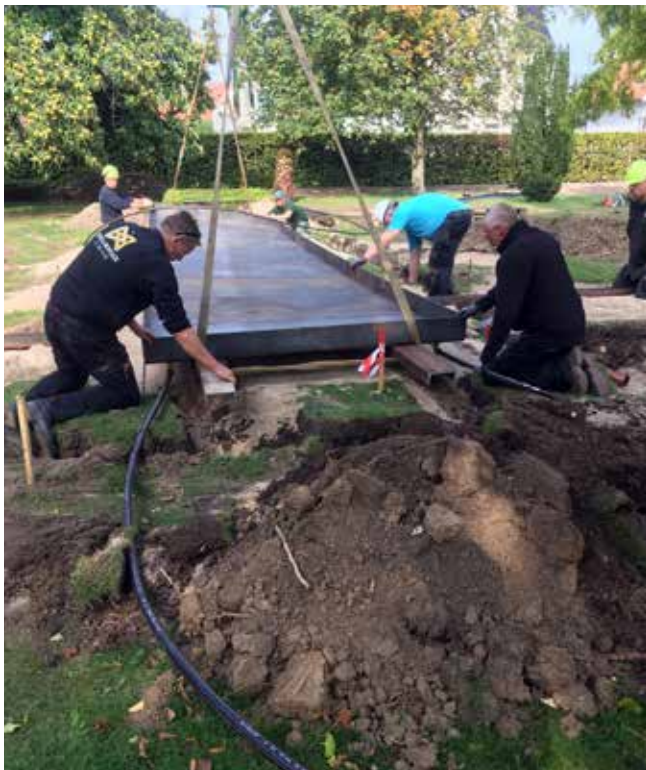
Stålkarret i Ginkgohaven hejses på plads.