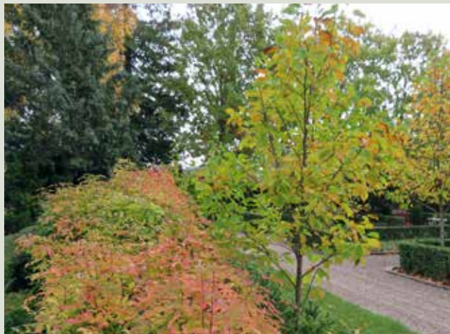
Blærenød og Magnolie 'Galaxy'.