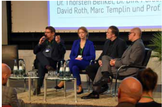
En af dagens tre paneldiskussioner.

gravminde på et gravsted, hvor det var sat en guitar, og en afdeling hvor dyr begravnes ved siden af mennesker og til-ladelse til begravelser om natten med fakler. Kirkegården er blevet en populær gravplads, og der er opstået et ønske om andre gravstedstyper. Det seneste anlagte rum har karakter af en fortolkning af plade i plæne. På den måde bekræftede anlægget, at der ikke er alternative gravsteder, men at der også skal være plads til det traditionelle.