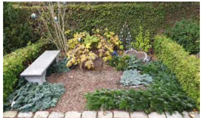
På urnegravsteder lægges to border, på kistegravsteder suppleres med en dekoration.

spændende job med mange faglige, personlige og ledelsesmæssige udfordringer. Nu ville skæbnen, at stillingen som kirkegårdsleder ved Roskilde Kirkegårde blev ledig pr. 1. november 2018. Det blev en kort men god tid i Hvidovre, for fristelsen i form af en større kirkegård, historisk vingesus så det basker og kortere transporttid var for stor. Da jeg fik tilbudt stillingen i Roskilde kunne jeg derfor – med en blanding af vemod og glæde – sige farvel til Hvidovre.