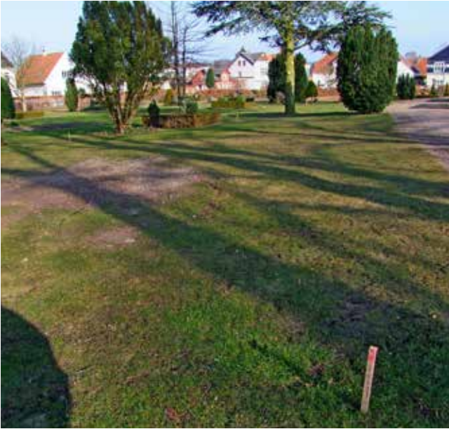
Rummene er afsat i en tidligere kisteafdeling på den nordlige del af Nyborg Kirkegård.