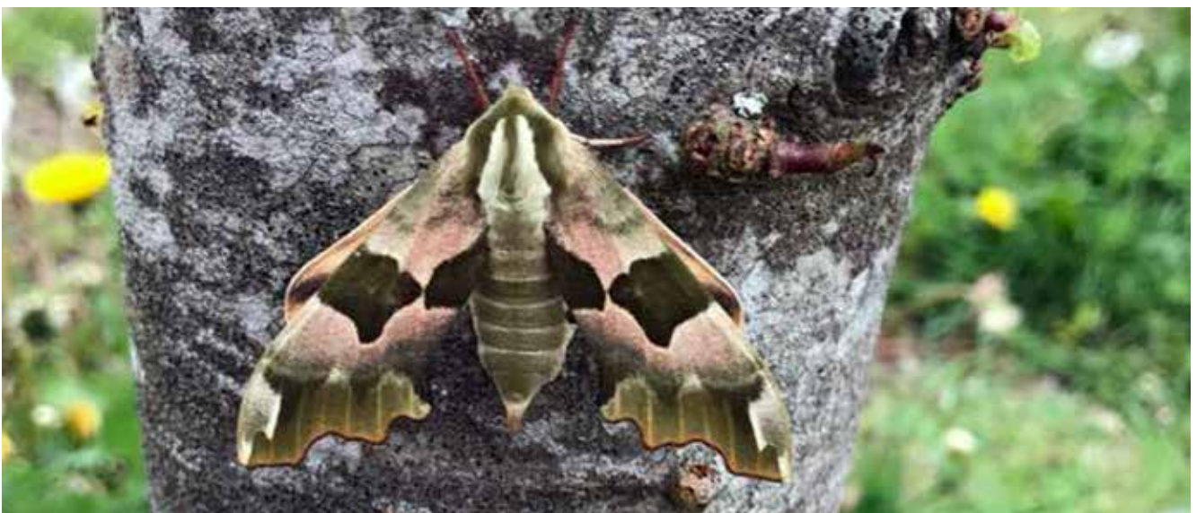
Lindesværmer som larve og voksen. Den voksne Lindesværmer er fotograferet af Uffe Nygaard.