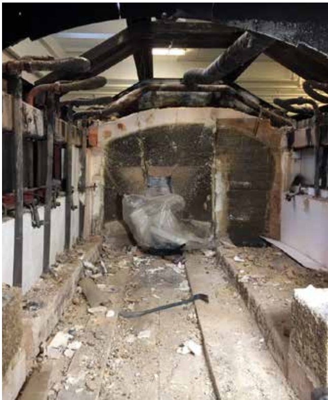
Den udtjente foring er fjernet.