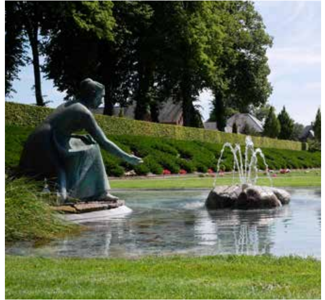
Springvand i urnegården anlagt i den gamle voldgrav sidst i halvtredserne.