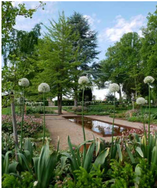
I Ginkgohaven står Allium 'Mount Everest' meget flot.

Som led i en udviklingsplan for Nyborg Kirkegård blev der i 2017-18 etableret nye urneafdelinger med vandbassiner.