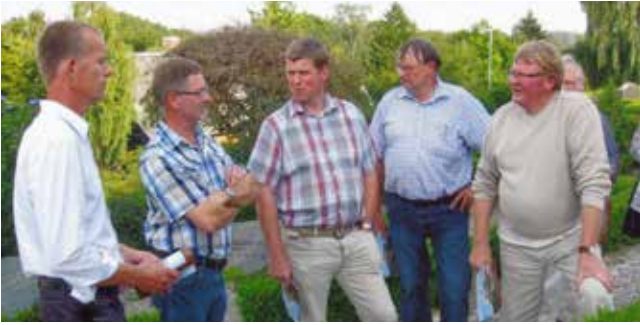
Netværket arrangerer bl.a. møder, hvor de enkelte medlemmer er vært på egen kirkegård og i eget hjem.