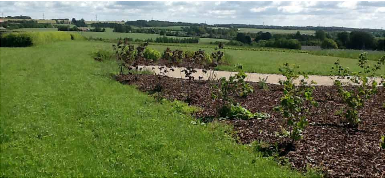
Der er bl.a. anlagt en plads til bord, bænke og bålplads, samt plantet bærbuske og sået blomstereng.