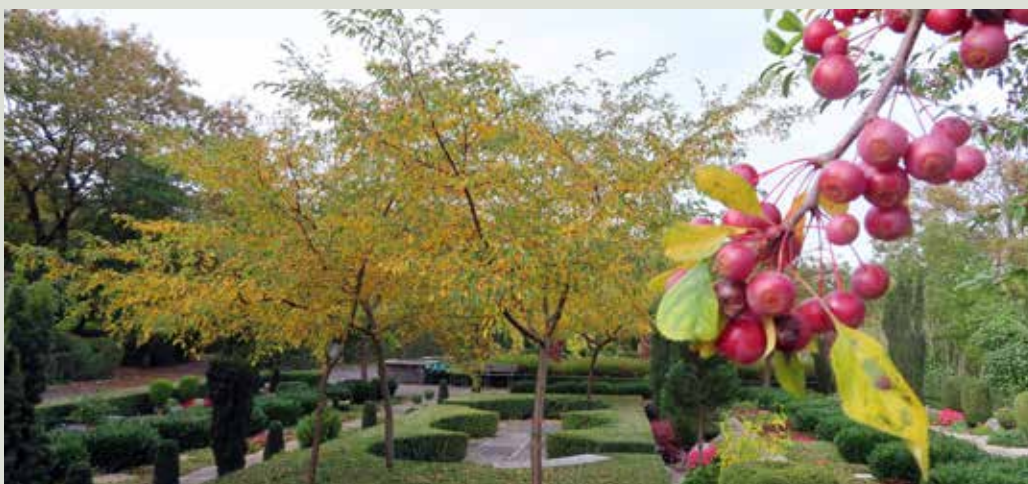
Paradisæble 'Hesse', med bund af Buksbom.

Jeg tror grunden til at vi har bevaret så mange løvtræer, er, at der i mange år har været kirkegårdsledere som har udviklet kirkegården med både nål og løv, og som ikke har startet saven og fældet pga. at det "sviner" på granpyntningerne.