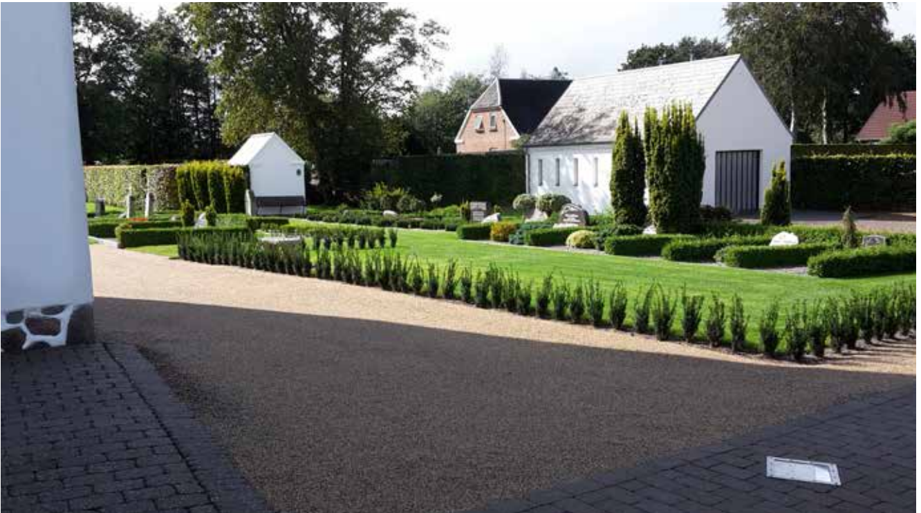
Syd for kirken er der bl.a. sået græs på de gamle stier og anlagt nye kombinationsgravsteder.

Området nord for kirken skal bestå af traditionelle gravsteder med grusbelægning, og området syd for kirken vil fremover bestå af kombinations-, urne- og plænegravsteder, med stisystemet udlagt i græs. Strategien blev, som tillæg til vedtægterne, godkendt af provstiet, sammen med en beslutning om stop af salg af gravsteder i området syd for kirken.