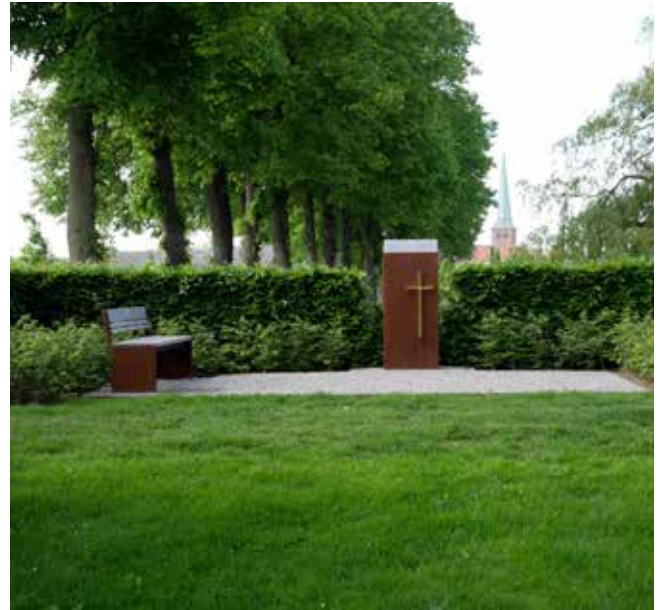
Blomsterplads til den anonyme fællesplæne.

viklingsplanen for Nyborg Kirkegård i 2010-11, blev det derfor besluttet, at nye urneafdelinger i den nordlige del af kirkegården også skulle indeholde et vandelement.