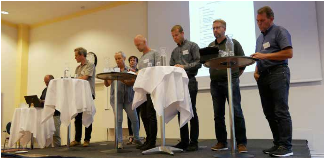
Fra FDK's generalforsamling.

I forbindelse med årsmødet 2019 på Hotel Helnan Marselis i Aarhus, afholdt både DKL og FDK deres årlige generalforsamling.