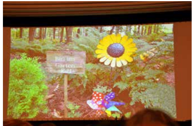
Gravsted på begravelsespladsen i Bergish Gladbach

liberalisering af forudbestemte rammer. Det fysiske gravsted vil også i fremtiden være omdrejningspunktet for vores opfattelse af et gravsted. Derimod er der ikke fokus på om gravstedet befinder sig på en eksisterende kirkegård, eller stedet har en anden placering. Samtidig viste forskningsresultaterne, at det virtuelle gravsted ikke vil overtage det fysiske gravsteds rolle i sorgprocessen. Det vil i stedet være et legitimt supplement som kan bruges til dagbogsrefleksioner og sorgbearbejdelse. Et eksempel på et forum for det virtuelle gravsted er www.friedhofssoziologie.de .