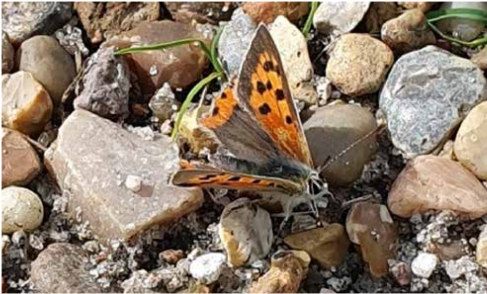
Lille ildfugl (adult)

gruppe. Bl.a. er der nogle edderkopper der vil have plads til store hjulspind, mens andre hellere vil have højt græs at jage i. Derfor har kirkegårde med deres forskellige gravsteder et stort potentiale til at rumme mange insekter, samtidig med at insekterne kan bo meget tæt på hinanden, selvom de har meget forskellige behov. Desuden giver bykirkegårdene et grønt område i et område hvor der ellers ikke er så meget grønt, andet end lidt græsplæner og mere eller mindre velholdte haver.