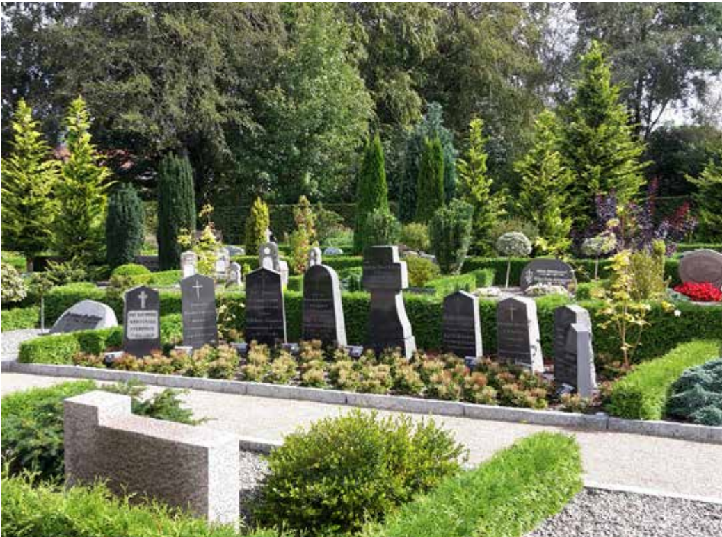
De bevaringsværdige og registrerede gravsten er flyttet fra det gamle lapidarium, og indgår nu i området med traditionelle gravsteder.

kirkegården i den ene eller anden grad, det gør det lettere at forklare de nødvendige ændringer.