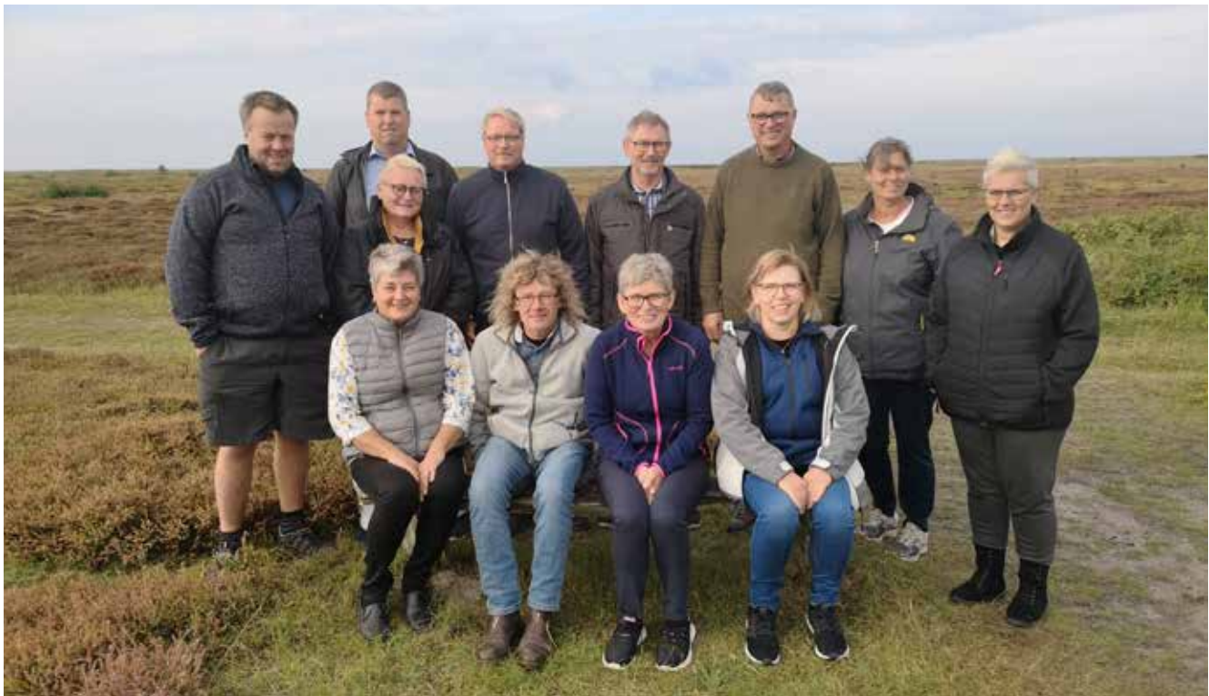
Netværkets medlemmer anno 2019

Januar 2007 så et nyt netværk dagens lys. Fundamentet var lagt, da 14 personer med lederansvar fra kirkegårde rundt omkring i landet tog på kursus i Nordjylland. De mødtes for at få sat personlig udvikling og erfaringsudveksling på dagsordenen.