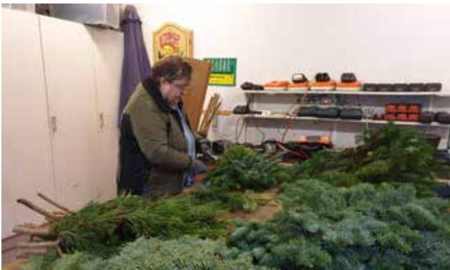
Dekorationerne kan laves indendørs.