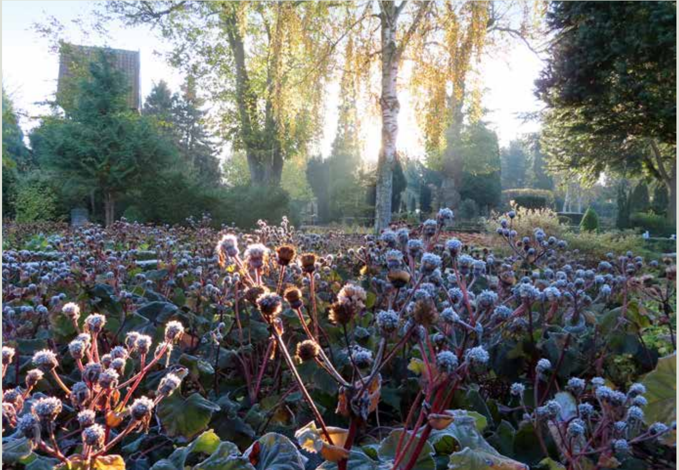
Ligularia dentata, Nøkketunge, med lidt rimfrost.