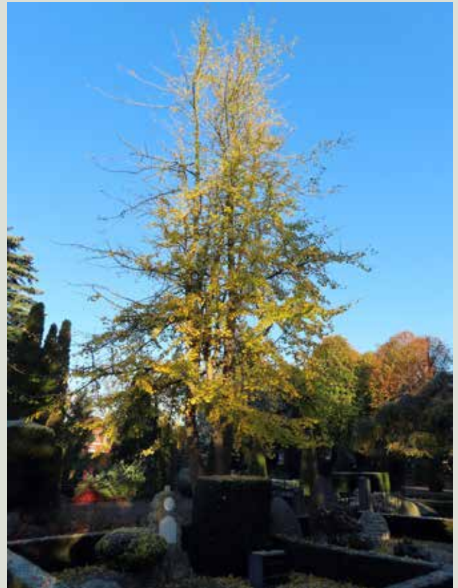
Ginkgo biloba, Tempeltræ, en af mine favoritter.

udviste ham denne store ære; at skulle opgraves og igen nedgraves var, at han havde foræret kirkegården et støbepjenshegn ud mod den ene vej.