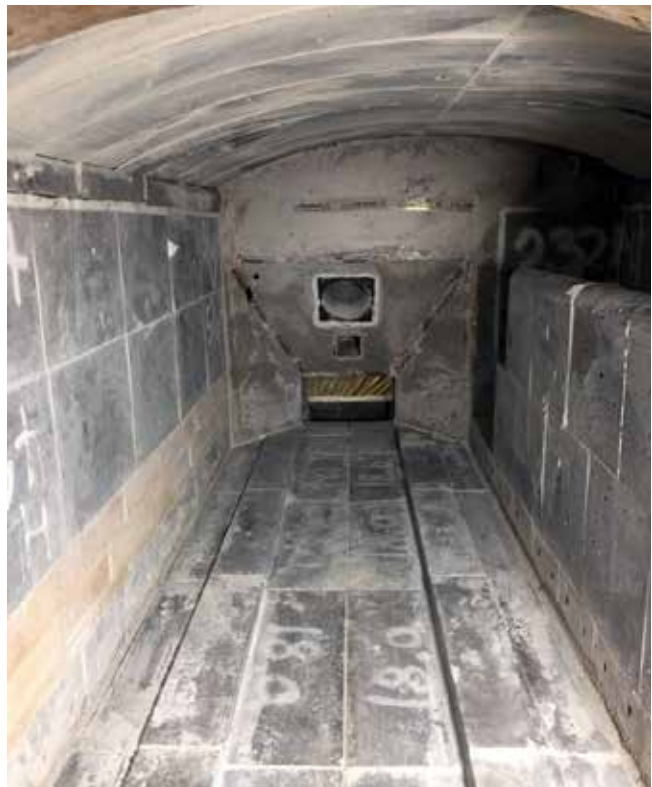
Ovnen er muret op på ny.

I efteråret 2019 har vi været igennem en ommuring af vores krematorieovn i Svendborg Krematorie. Her fortæles kort om forløbet.