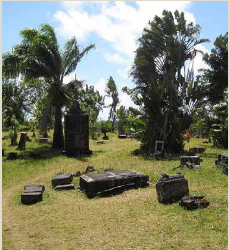
Flere pirater fandt deres sidste hvilested på kirkegården på Saint Mary's Island.