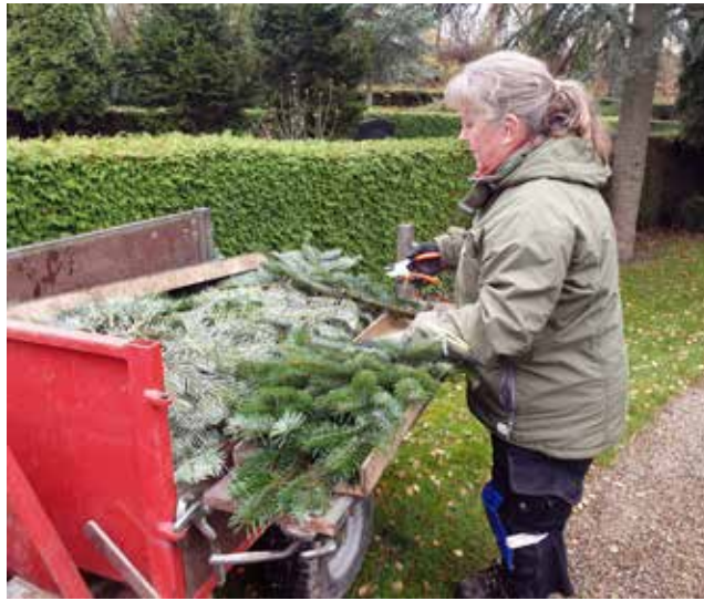
Grandækningen laves ved hjælp af slisker.