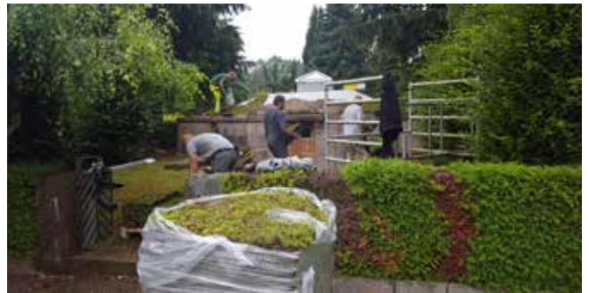
Græs og muld blev fjernet og det underliggende betontag blev renset og pudset.