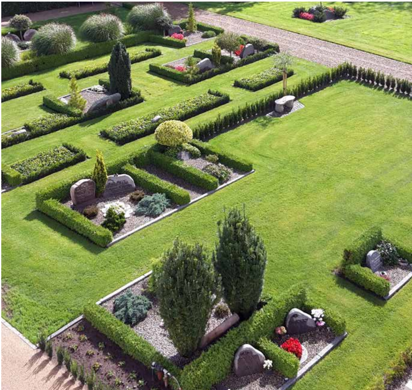
Kirkegården set lidt fra oven – Efter 2 år er vi kommet ret langt med omlægningen, og de store linjer er nu på plads.

og masser af sommerfugle og bier. Lågen til kapelstien, er blevet flyttet så der er et direkte kig til kapellet, og den gamle sti omlagt til græs.