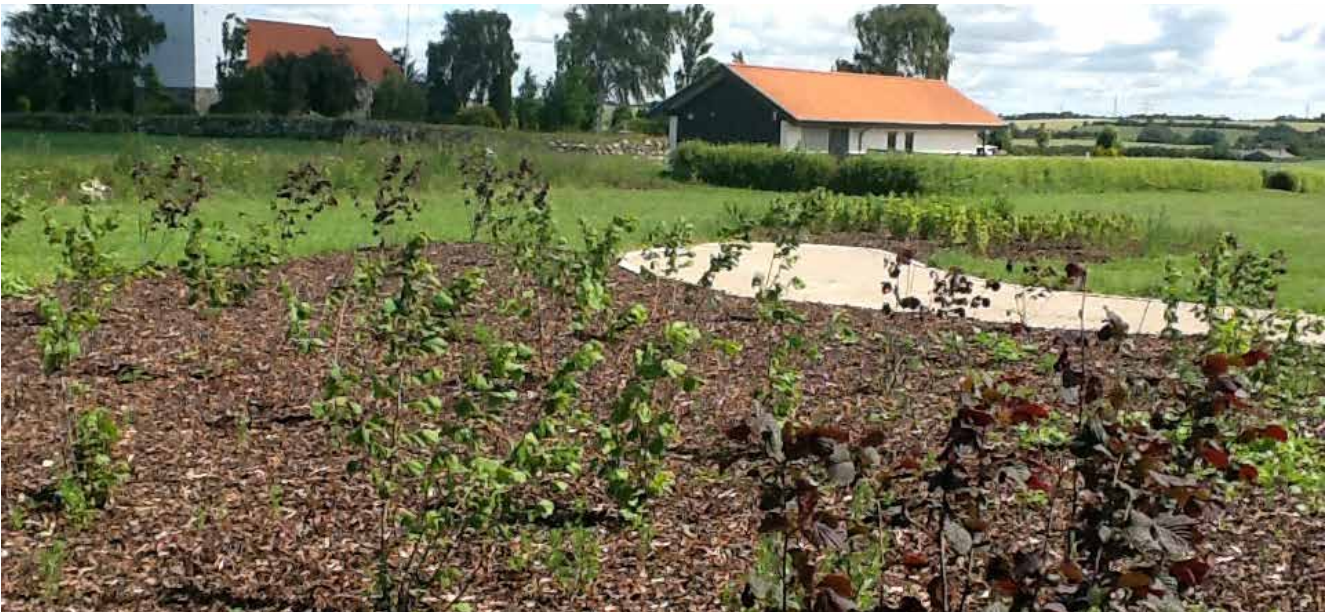
I løbet af det næste år vil der blive opsat shelters på arealet, så trætte vandrere kan få mulighed for at overnatte.

Flere og flere benytter sig af kirkens område, så både til dem og til os selv, ønsker vi at tilbyde et rart ophold med dette nye grønne område.