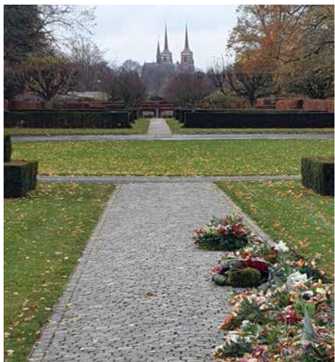
Udsigt fra fællesgraven til Roskilde Domkirke.

"HVIS det er muligt at tilpasse strukturer, kirkegårdsarealer og de økonomiske rammer til fremtidens ændrede krav i tide, så kan kirkegårdsdriften udvikles frem for afvikles – og det er naturligvis mit beskedne mål som kirkegårdsleder for Roskilde Kirkegårde."