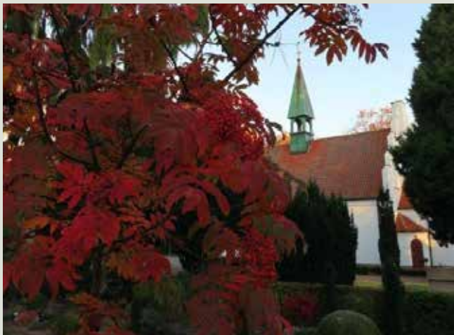
Sorbus sargentiana, en af de smukkeste Røn i høst.