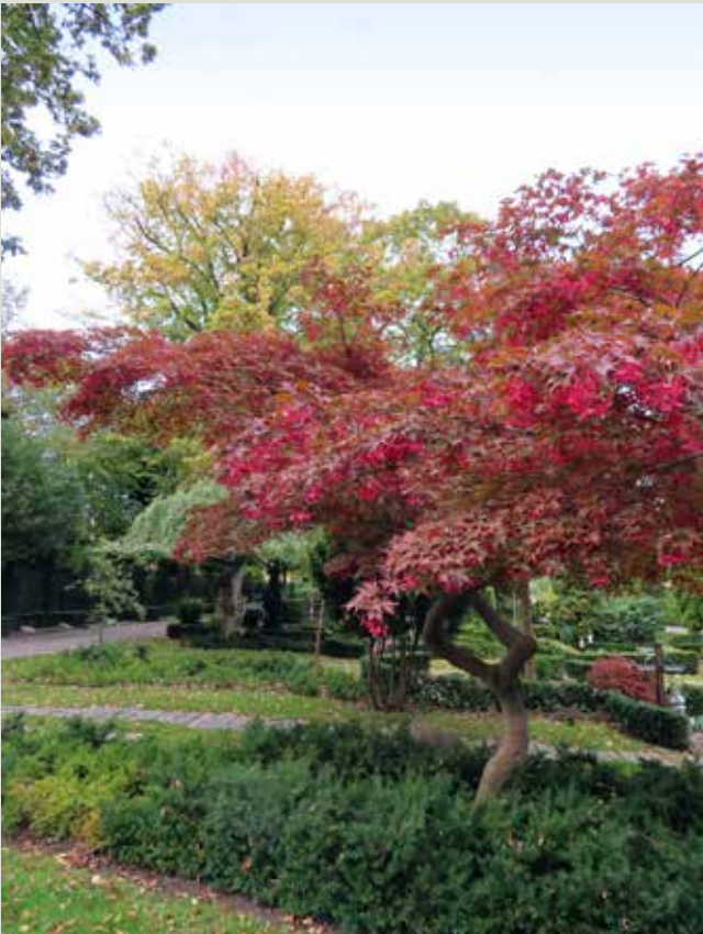
Japansk Løn, nok det smukkeste eksemplar på kirkegården.