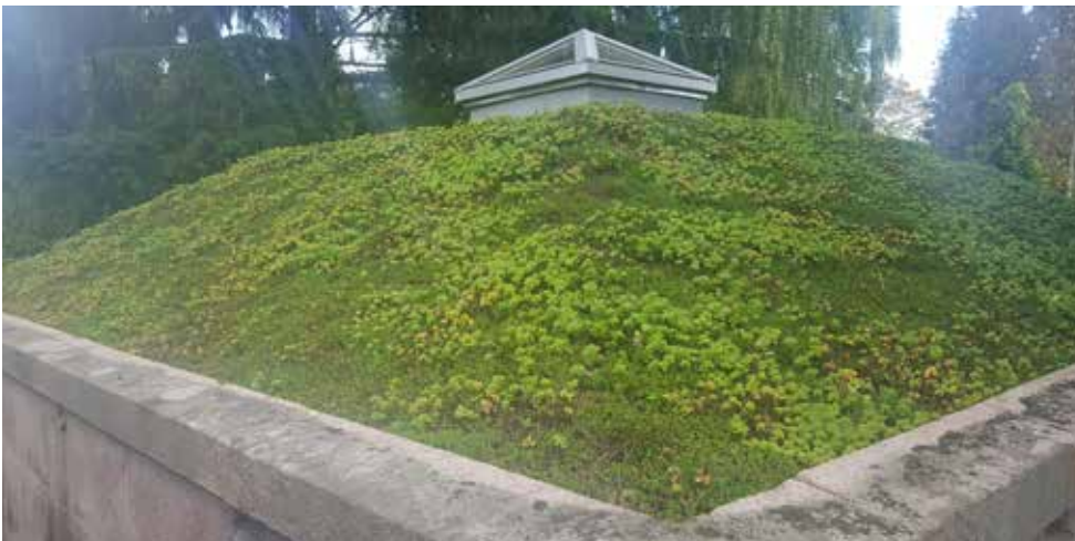
Der er nu lagt måtter af Sedum på taget af gravkammeret. Resultatet er blevet fint – og gartnerne slipper for at klippe græs ☺