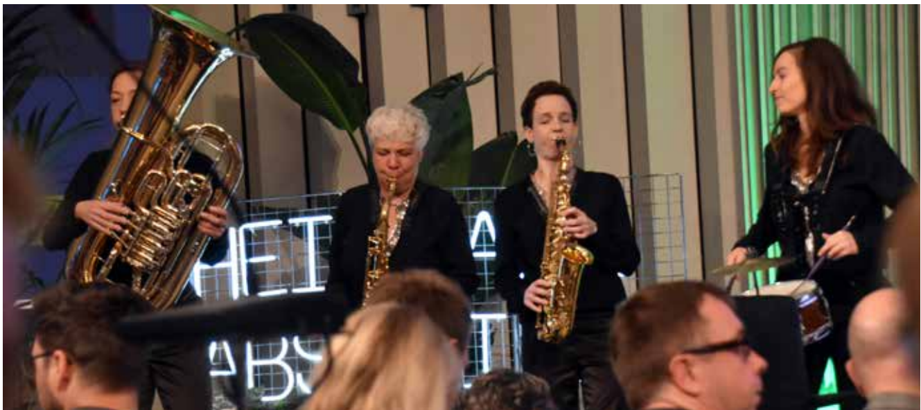
Åbning af konferencen.